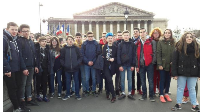
Elèves de 3è devant l'Assemblée Nationale (Paris)

Grâce aux nombreuses ventes organisées ces derniers mois, l'APEL a pu permettre aux familles de diminuer le coût des séjours à Paris (3è), classe de neige (5è) ou Londres (4è). En plus de la baisse pour tous (10 à 45 €) certains ont obtenu par leurs ventes une baisse de plus de 100 € suite aux opérations pizzas, galettes ou tombola de Noël. Bravo à tous les vendeurs.