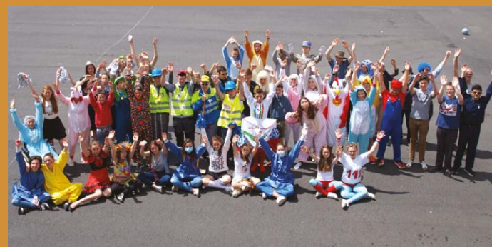
Remise officielle des diplômes au collège fin septembre

Le DNB se prépare dès le début de l'année scolaire car il prend en compte, de façon très significative, l'évaluation au contrôle continu sous la forme d'un bilan de fin de cycle 4. Huit composantes du socle commun de connaissances, de compétence et de culture sont évaluées sur quatre niveaux : de maîtrise insuffisante à très bonne maîtrise (400 points). Le collège organise 2 brevets blancs, en conditions d'examen, pour préparer au mieux nos élèves aux épreuves du mois de juin. Les élèves passent également un oral de projet (100 points), comptant pour le DNB, au sein de l'établissement. Les épreuves du contrôle final sont sur 300 points. Outre l'oral de projet, elles se composent de deux épreuves écrites sur 100 points chacune : une de Mathématiques et de Sciences, une de Français et d'Histoire-Géographie-Education Civique.