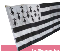
Le Gwenn ha du flotte au collège Saint-Yves